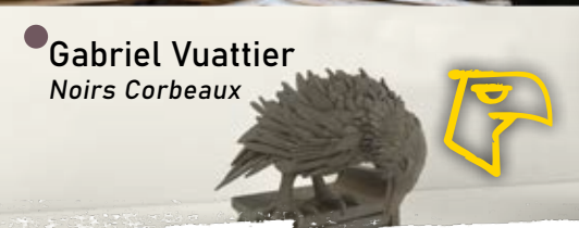
● Gabriel Vuattier Noirs Corbeaux