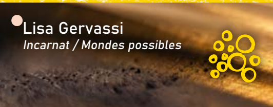
● Lisa Gervassi Incarnat / Mondes possibles