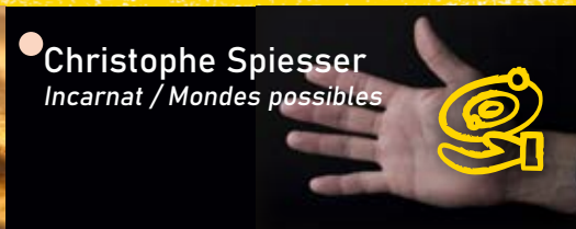
● Christophe Spiesser Incarnat / Mondes possibles