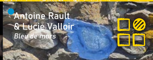
● Antoine Rault & Lucie Valloir Bleu de murs