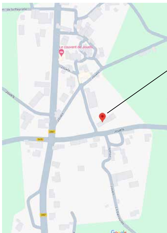
Ancienne école dans Jouels

Pôle des Métiers d'Art du Pays Ségali Espace Lapérouse - 12800 Sauveterre-de-Rouergue 06 98 61 74 64 - artetsavoirfaire@gmail.com www.artetsavoirfaire.com